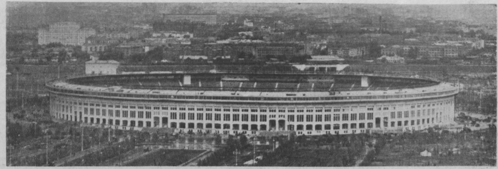
Москва. Центральный стадион в Лужниках. Большая спортивная арена.

ПЕКИН, 30 июля. (ТАСС). Комментируя решение египетского правительства о национализации компании Суэцкого канала, газета «Жэньминьцзяобао» пишет в редакционной статье, что все народы мира, выступающие против колониализма, в защиту национальной независимости, искренне поддерживают и приветствуют этот шаг Египта.