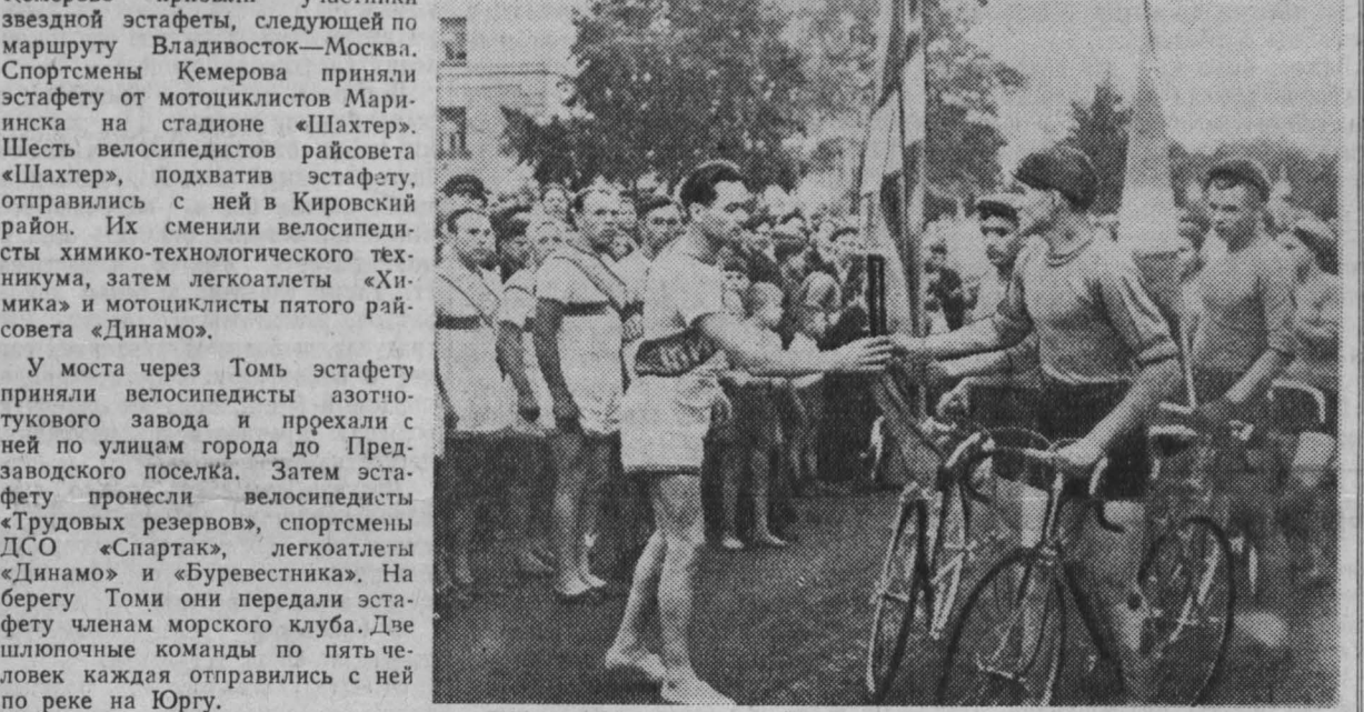
Звездная эстафета посвящена Спартакиаде народов СССР. Ее конечный пункт — Москва. На пути прохождения эстафеты велосипедистами ДСО «Спартак», легкоатлетом ДСО «Динамо» и мотоклисту пятого райсовета «Динамо».

В Кемерове ее участников тепло встречали трудящиеся города. НА СНИМКЕ: передача эстафеты велосипедистами ДСО «Спартак» легкоатлетам «Динамо». Текст П. Антонова.