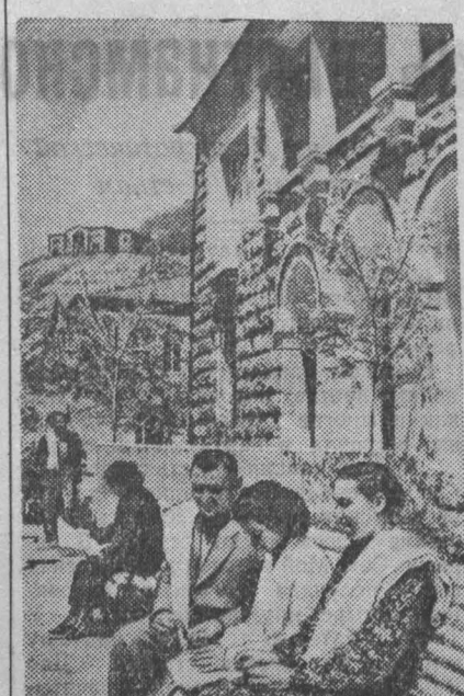
Армянская ССР. В горной местности, на высоте 2100 метров над уровнем моря...