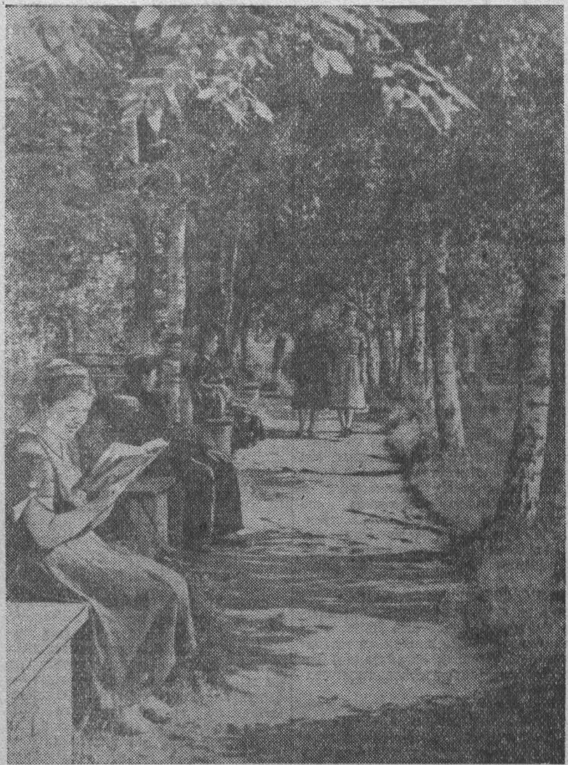
Рядом с административно-бытовым комбинатом шахты «Абашевская-1» треста «Куйбышевуголь» шахтеры в свободное от работы время работают в саду. Теперь он разросся и является любимым местом отдыха горняков.