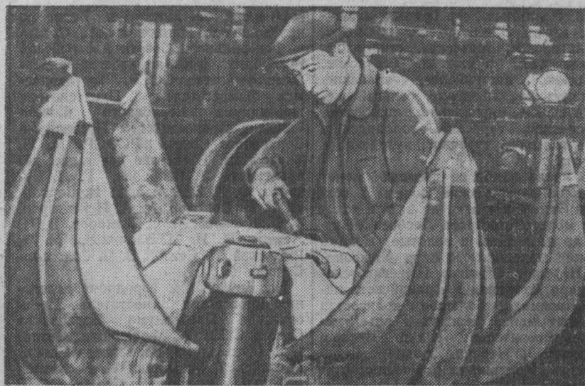
Коллектив Кузнецкого машиностроительного завода освоил новый вид продукции — пневмопогружники «КС-3». Изготовлено уже несколько новых машин.