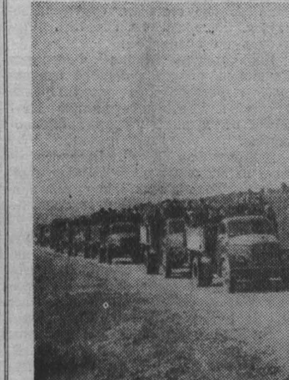
Грузовики выкатываются на асфальтовую гладь шоссе Сталинск—Междуреченск.

Мы приехали помочь в освоении природных богатств Кузбасса, — заявила бывший членчетар Гринцевского паровозного