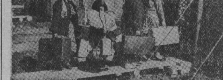
Новоселы размещаются в уютных палатках.

строительство молодежных общежитий. Рассчитываем организовать работу поточно-скоростным методом. Пока одни беседуют, другие новоселы размещаются в уютных палатках. Минуту они еще осматриваются, а затем начинают по-хозяйски расставлять вещи. На тумбочки водружаются богатые подарки. Вот