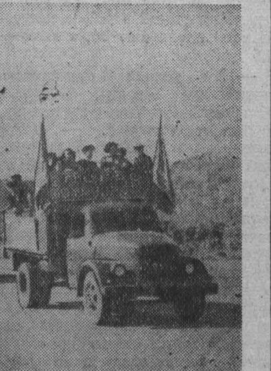
Здесь состоялся митинг.

Томь и выходит на асфальтовую гладь шоссе Сталинск—Междуреченск. Дорога подходит к самому берегу Томи. — Места-то какие... Красота... — радуются звонкие голоса. — Нет, смотрите сюда, — показывают молодые строители на правый, поросший густой растительностью берег большой реки, и их протоптанные ручьи отражаются в зеркале воды.