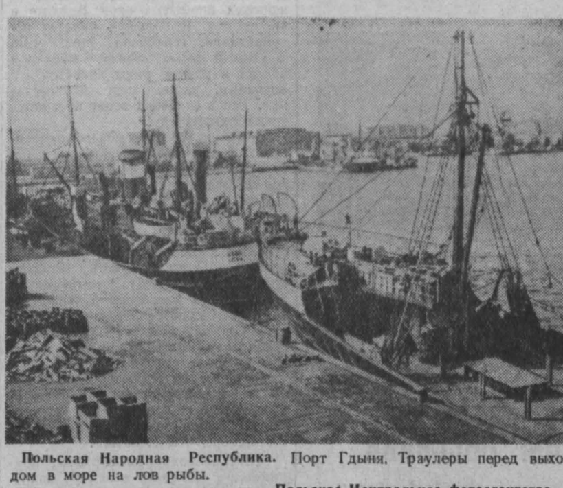
Польская Народная Республика. Порт Гдыня. Траулеры перед выходом в море на лов рыбы.

Вчера же президент Ливана пригласил к себе государственного министра Сабба Салама и министра иностранных дел Салима Лахуда и обсудил с ними результаты своей беседы с послами США и Англии. Газета «Телеграф» подчеркивает, что Сабб Салам выразил возмущение вмешательством США и Англии во внутренние дела Ливана. Такое место вмешательства, заявил он, имеет место вопреки тому факту, что Ливан является независимой и суверенной державой. Этому надо положить конец, добавил Салам.