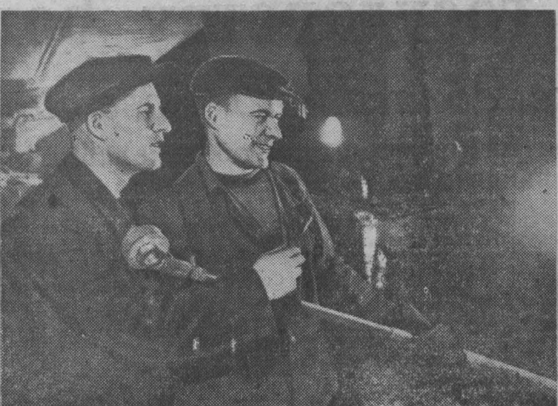
На Кузнецком металлургическом комбинате все мартеновские печи оборудованы стационарными установками для измерения температуры стали. Установка состоит из быстродействующего электронного потенциометра и переносной термометрии, которая подключается к специальному контакту непосредственно у печи. Через 15 секунд сталевар узнает точную температуру металла.

Цель поездки — познакомиться с жизнью венгерского народа и историческими памятниками страны. М. Алексева.