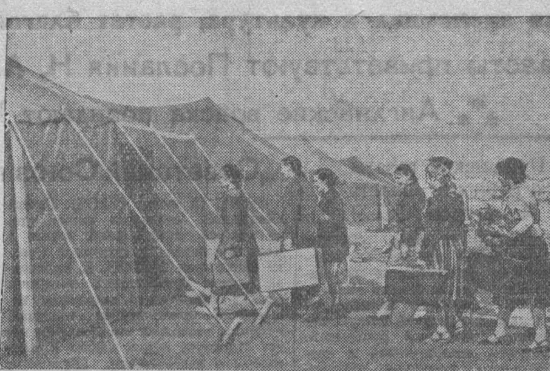
Новосибирская область. Обращение ЦК КПСС и Совета Министров СССР нашла горячий отклик у молодежи области...