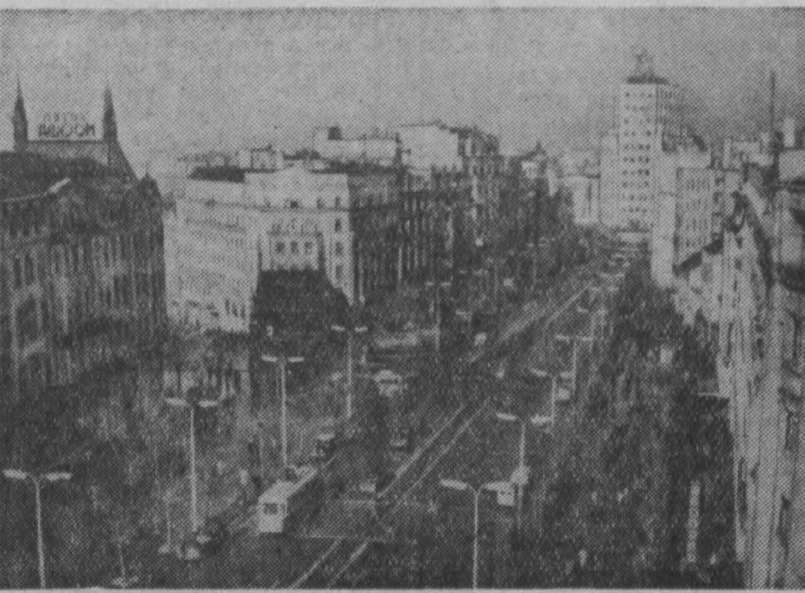
Федеративная Народная Республика Югославия. Центр Белграда — площадь Теразеје.

Перед отъездом в Советский Союз от имени народов Югославии я пишу народам Советского Союза горячие приветствия, желаю им счастья и дальнейших успехов в своем развитии».