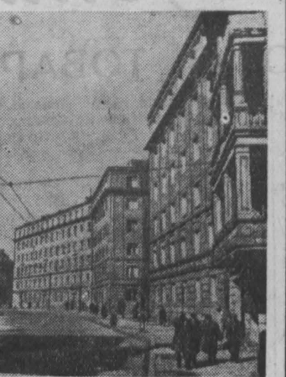
НА СНИМКАХ: 1. Новый молочный комбинат в Градец-Краловской области (Чехословакия); 2. Учительница лекционной начальной школы Куан Чи (Китай) на прогулке с учениками. Куан Чи свыше 20 лет ведет преподавательскую работу. За успехи в воспитании учащихся учительница награждена специальной премией; 3. Жилые кварталы на улице Либорта в г. Познани (Польша).