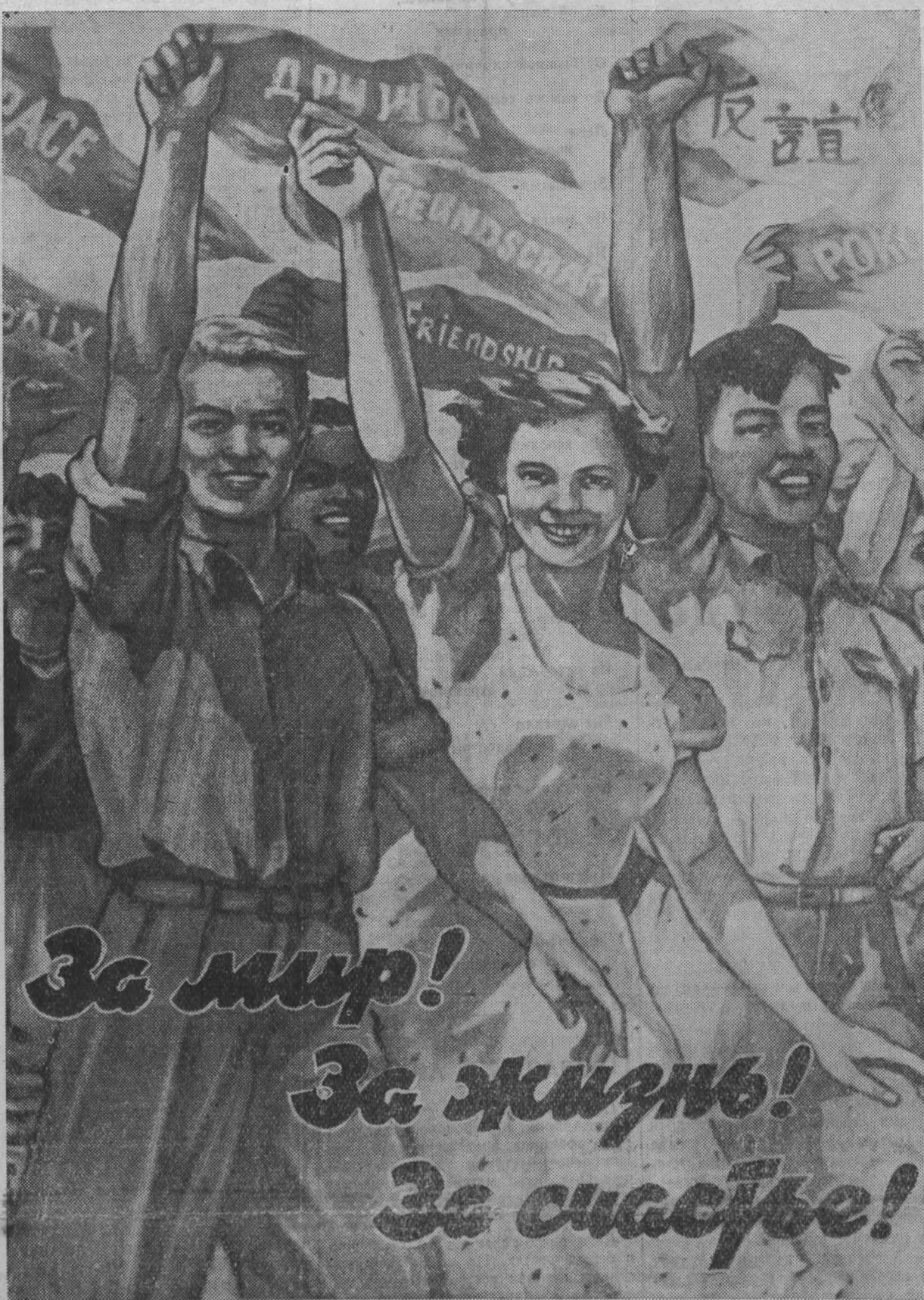
Плакат художника Н. Ватолина (ИЗОГИЗ).

— Да здравствует 1 Мая, день международной солидарности трудящихся, день братства рабочих всех стран!