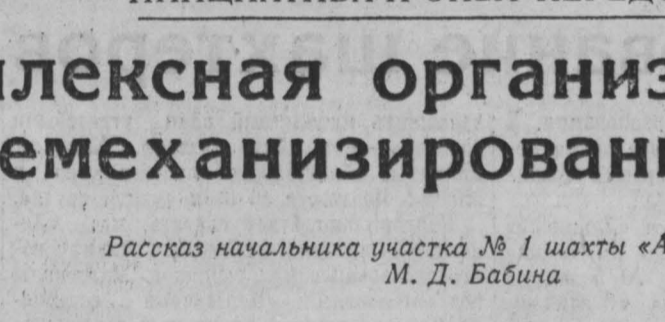
М. Д. Бабин.