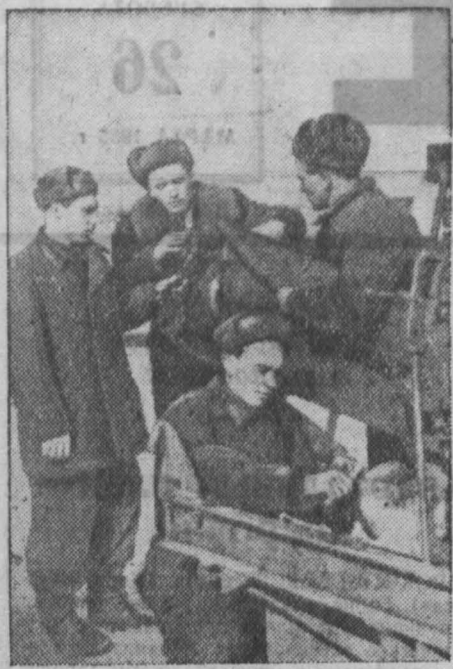
В Елкаевской МТС нахалются на практике учащиеся Кемеровского училища механизации сельского хозяйства № 4 — группа комбайнеров и трактористов. Они оказали большую помощь в ремонте тракторов и сейчас приступили к ремонту комбайнов.