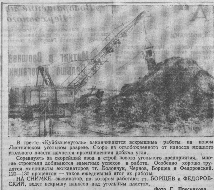
В тресте «Куйбысуголь» заканчиваются вскрышные работы на нозом Листьянском угольном разрезе. Скоро из освобожденного от наносов мощного угольного пласта начнется промышленная добыча угля.