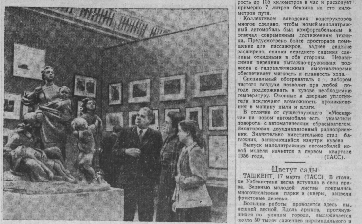
Москва. Всесоюзная художественная выставка. НА СНИМКЕ: посетители осматривают скульптуру Е. Белашовой-Алексеевой «Этого нельзя забывать».

«Об изменении практики планирования сельского хозяйства» Государственное издательство политической литературы выпустило в свет брошюру с текстом постановления Центрального Комитета КПСС и Совета Министров СССР, принятого 9 марта 1955 года, «Об изменении практики планирования сельского хозяйства».