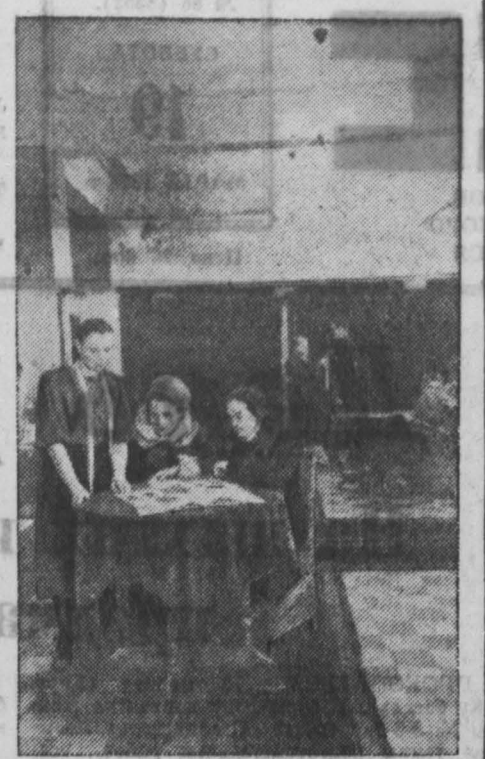
Кемеровское швейное ателье № 1 недавно перешло в новое здание по улице Советской. Здесь удобно разместилась все цеха мастерской.

Пленум горкома партии принял решение, направленное на усиление руководства комсомольскими организациями города.