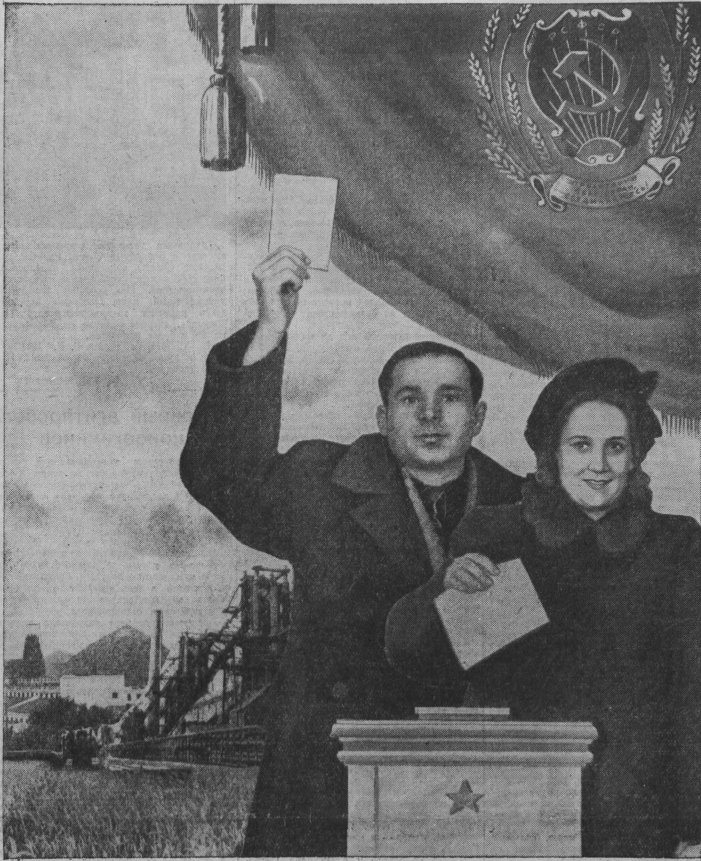
Фотоплакат В. Скоробогатова.

В этом году колхозники решили увеличить посевы кукурузы в 14 раз. Для этой цели они отвели 540 гектаров глубокой зяби плодородных пойменных земель. Вся площадь будет засеяна квадратно-гнездовым способом.