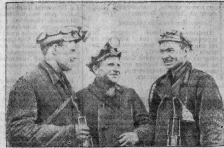
С хорошими производственными показателями идут навстречу дню выборов в Верховный Совет РСФСР и местные Советы горняки участка № 4 шахты имени Ворошилова. Только в январе они добыли сверх плана 1300 тонн угля.

★ Огромные средства вложены в обеспечение дальнейшего роста культурного и материального благосостояния