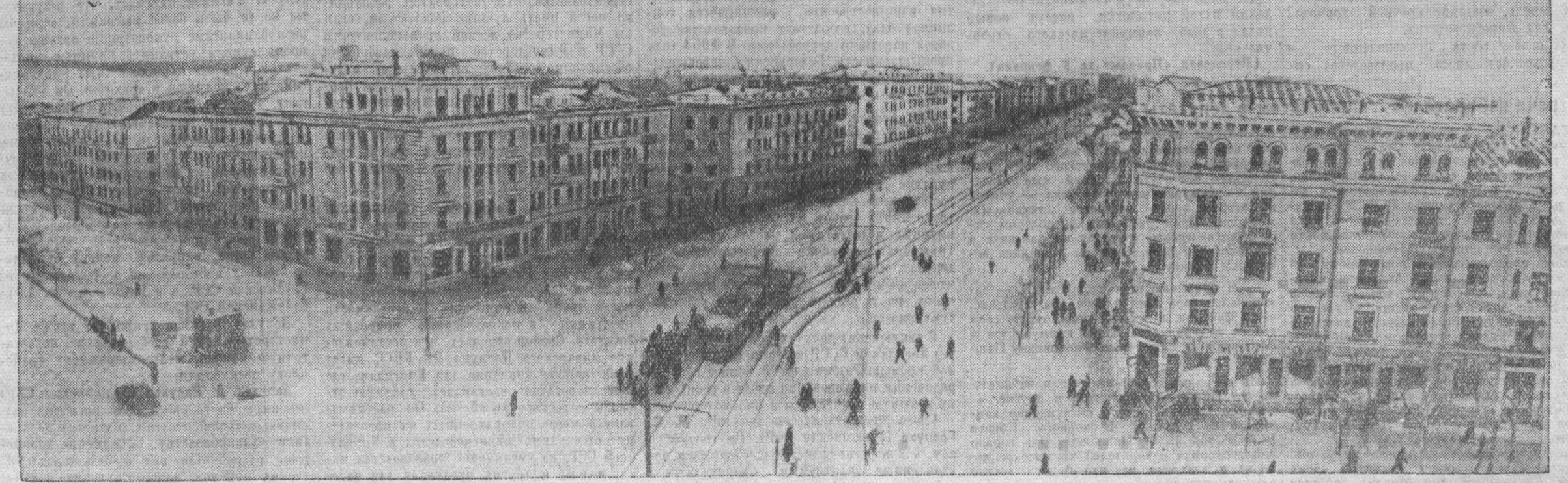
На углу улиц Советской и Гирова особенно приятно задержать свое внимание.

Размах от центра до окраин — Как будто крылья у орла. Твоих гудков звучат раскаты, Как обновления сигнал, Трудолюбивый и богатый, Ты нам еще дороже стал. В твоих домах широколучных, В просторе улиц, площадей Заслуженно увековечен Упорный труд твоих людей. Хотя ты внешне прост и скромно, Подобно жителям своим, Твоих побед ты огромен, Залас богатства нечуждым. От удобрений и лекарств До кокса, угля и машин — Все для родного государства Даешь, Отчизны верный сын.