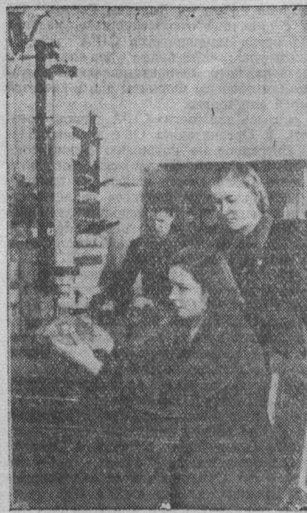
Кемеровский пединститут. На занятиях в лаборатории физпрактикума. Кажется, совсем недавно открыт он, этот институт, а его известность уже перешагнула границы не только родного города, но и Кузбасса.