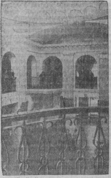
Фойе нового клуба ГРЭС, недавно построенного на самой оживленной Советской улице. Это еще один подарок трудящимся нашего города. Уже сейчас в клубе можно посмотреть кинофильмы.