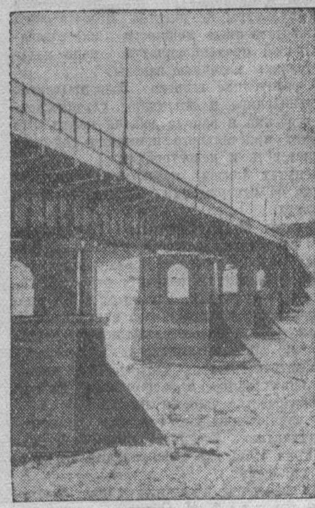
Коммунальный мост через реку Томь. Им вправе гордиться жители нашего города. В нем увековечен труд рядовых людей. Мост еще больше сблизил правобережье с левым берегом, с центром.