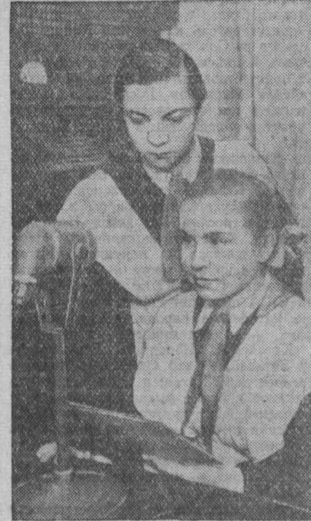
Новая школа № 25 в Кировском районе. В школьном радиоузле. О самых срочных делах можно оповестить всех пионеров и школьников с помощью своего радиоузла.