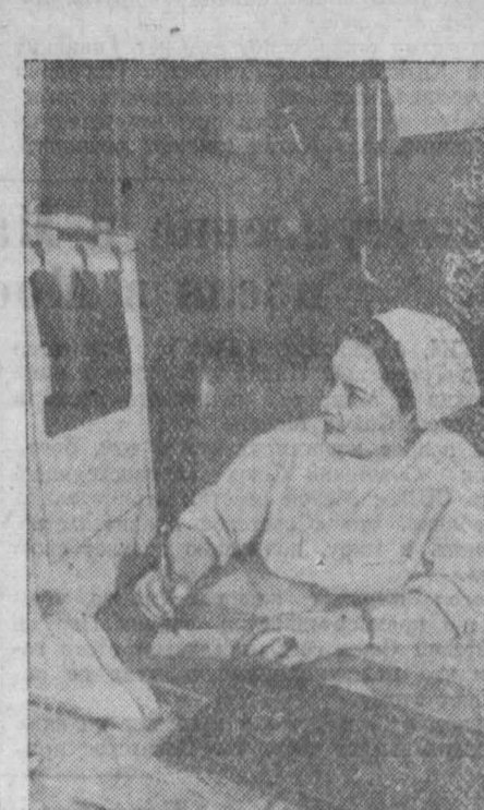
В поликлиническом отделении городской больницы. От внимательного глаза врача-рентгенолога не ускользнет ни малейший намек на заболевание, готовое подкраться к любой области человеческого организма.