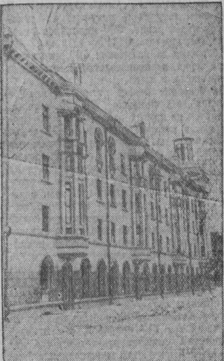
Жилый дом на улице Н. Островского. Он привлекает внимание горожан не только своим размахом, но и тщательной, искусной отделкой. Построена пока часть ансамбля, который будет одним из самых красивых на улице.