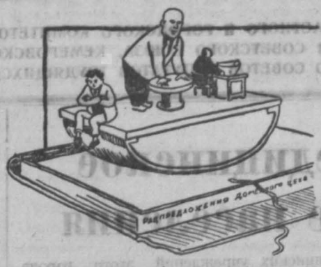
Мемло ценных предложений — в них творчество, порыв и пыл. Не устояли внедрения и интерес уж к ним остыл.

Кузнецкий металлургический комбинат имени Сталина — передовое предприятие Кузбасса.