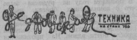
Вот достижения XX века, Паод дерзновенной мечты человека.

Кузнецкий металлургический комбинат имени Сталина — передовое предприятие Кузбасса. Труженики его, претворяя в жизнь решения Пленума ЦК КПСС, настойчиво борются за улучшение выпуска металла, улучшение организации производства, повышение качества выпускаемой продукции, внедрение передовой технологии и новой техники.