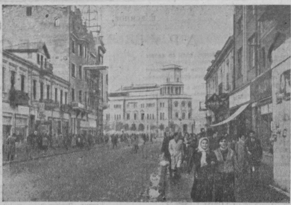
В Федеративной Народной Республике Югославии. НА СНИМКЕ: в городе Скопье.

Число ветеринарных работников за последние семь лет возросло более чем в три раза.