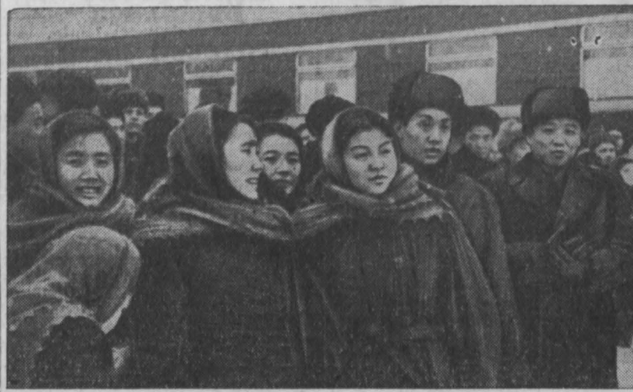
Вот они, дорогие гости!

Приезд в Кемерово артистов цирка Китайской Народной Республики