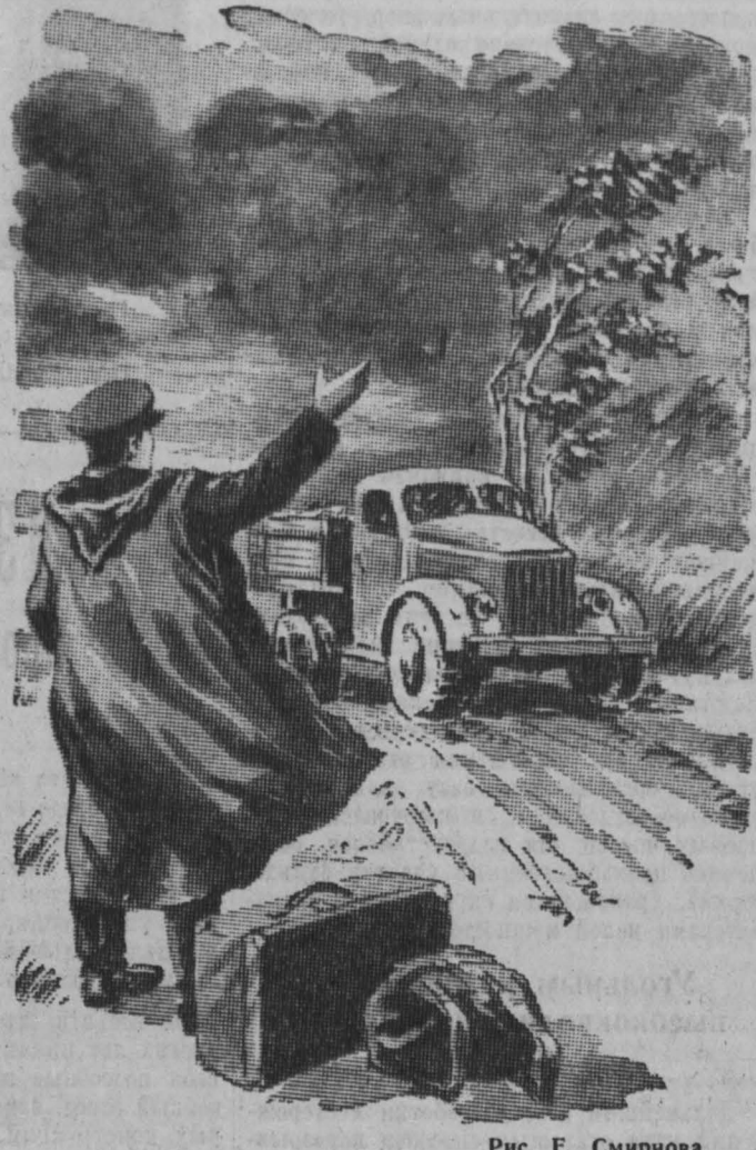
Рис. Е. Смирнова.

дило шофера, ранее связанного чем-то, — машина пошла быстрее. Майор строго посмотрел на шофера. Тот протонал, как от боли, — машина сбавила ход. Завылся поединок. — Давай быстрее! — кричала девушка, и щеки ее загорелись, обожженные гневом. Машина рванулась вперед. Металлически холодно блеснули колючие глаза майора. Машина сбавила ход.