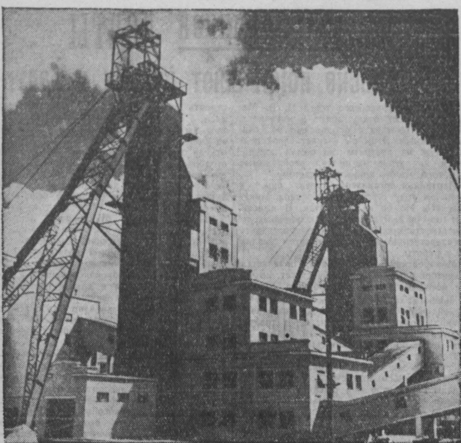
Китайская Народная Республика. Пробную продукцию угля дала новая Душаньская наклонная шахта в Хегани (Северо-Восточный Китай). С введением в эксплуатацию новой Душаньской наклонной шахты Хэганские копи в целом увеличат свою продукцию на сорок процентов. НА СНИМКЕ: внешний вид новой Душаньской наклонной шахты.