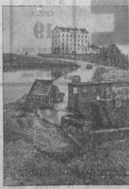
В Саратовской области строятся автомобильные дороги, которые свяжут районы освоения целинных земель с железнодорожной магистралью.

НА СНИМКЕ: сооружение 150-километровой трассы Пугачев—Перелоб. Эта дорога соединит крупнейший в области Перелобский район с городом Пугачевым и железнодорожной станцией.