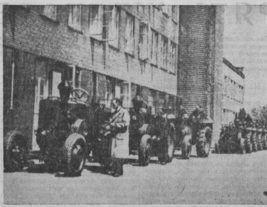
Польская Народная Республика. Тракторный завод «Урсус» близ Варшавы непрерывно увеличивает выпуск машин для сельского хозяйства страны. В первом полугодии 1955 года польская деревня получила тракторов на 20 процентов больше, чем за тот же период предыдущего года. НА СНИМКЕ: готовые к отправке тракторы на заводском дворе.