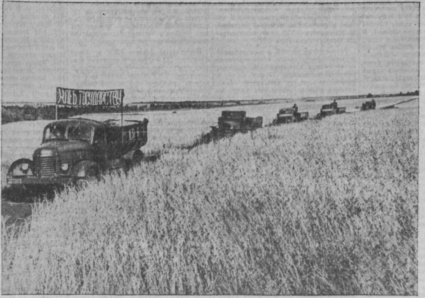
НА СНИМКЕ: автоколосна со сверхплотным зерном отправляется на элеватор.

В стаффасном цехе Сталинградского тракторного завода установлен аппарат с радиоактивным кобальтом, позволяющий обнаруживать дефекты литья. Применение его резко снижает брак в литейном производстве и сэкономит на этом около миллиона рублей в год. На заводе установлен также аппарат для выявления износа деталей тракторов с помощью меченых атомов.