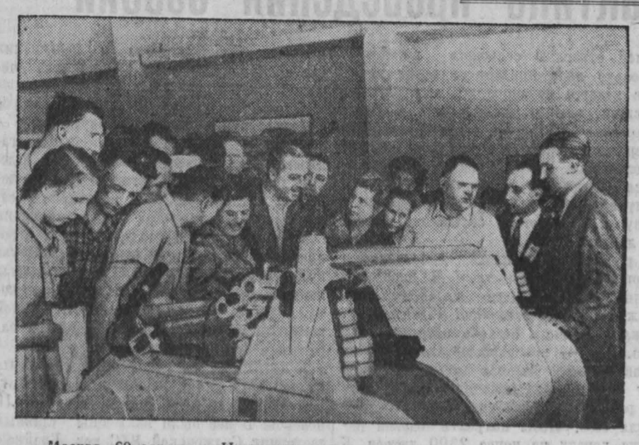
Москва, 20 августа в Центральном парке культуры и отдыха имени Горького состоялось открытие выставки «10 лет народно-демократической Чехословакии». НА СНИМКЕ: посетители наблюдают за работой швейко-ткацкого станка, установленного в одном из павильонов.