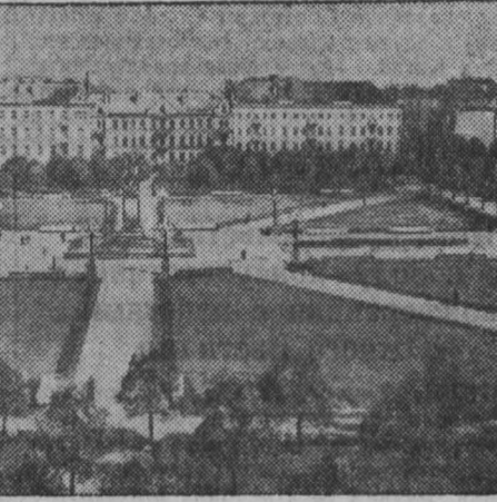
Литовская ССР. Площадь имени Ленина в Вильнюсе. Фотохроника ТАСС.

В Литве работают тысячи массовых библиотек, клубов, кинотеатров, домов культуры, театров, больниц, детских садов и яслей, санаториев и домов отдыха. Для трудящихся созданы все условия для труда, учебы и отдыха.