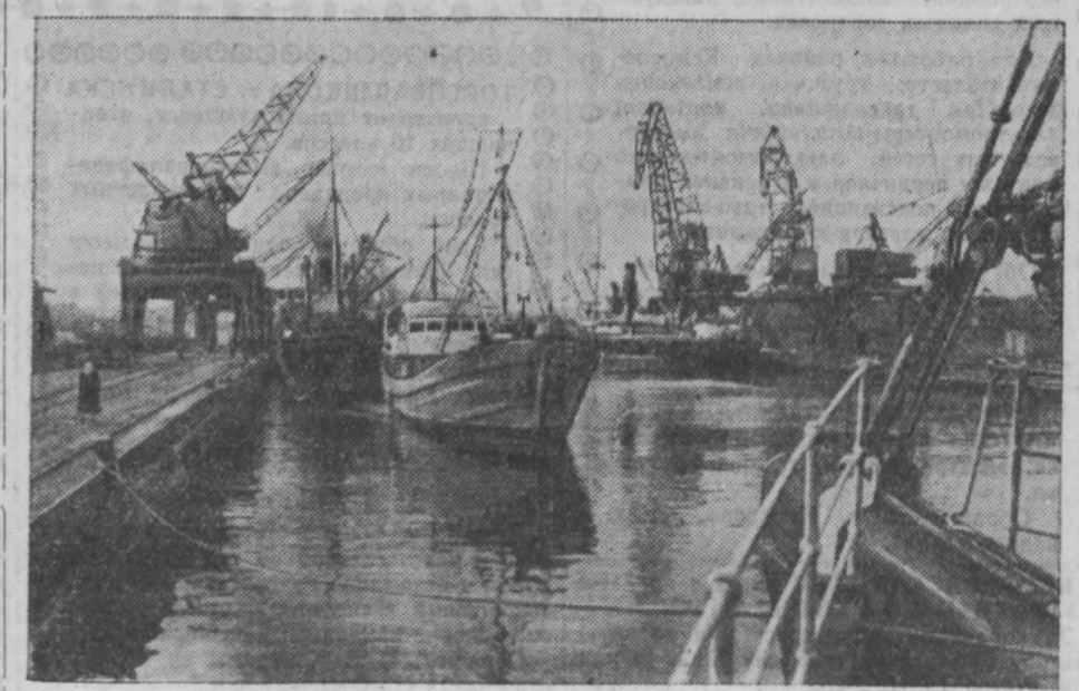
Эстонская ССР. Таллинский морской порт, разрушенный в годы войны, заново создан руками советских людей. В порту механизировано около 90 процентов погрузо-разгрузочных работ. Коллектив порта широко развернул соревнование за досрочное выполнение пятилетнего плана. НА СНИМКЕ: в Таллинском морском порту.

Эстонский народ, уверенно идущий по пути коммунистического строительства, своим честным трудом укрепляет могущество нашей Родины, вносит вклад в общее дело борьбы народов за обеспечение мира во всем мире.