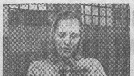
Прокопьевск. Цинковщина гальванического цеха...