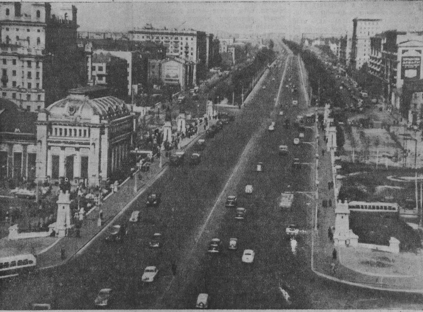
Москва сегодня. Ленинградское шоссе.