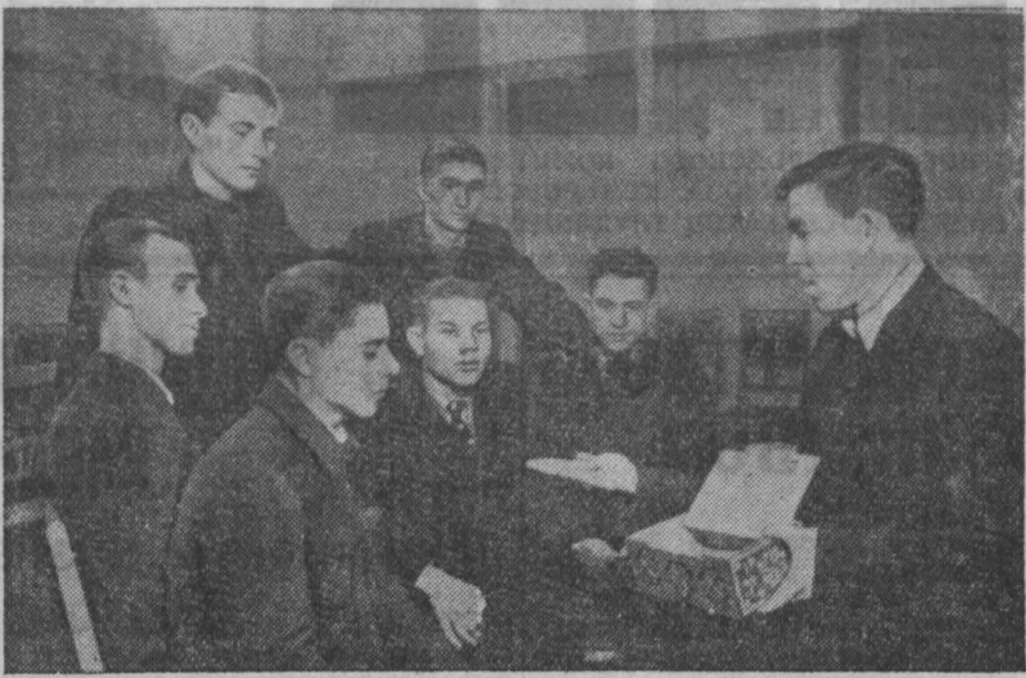
Весной прошлого года сотни молодых рабочих и работниц Московского автозавода имени Сталина по зову партии уехали на освоение целинных и залежных земель Алтая и Казахстана. Закончив сельскохозяйственный год, многие из них приехали в отпуск в столицу. Молодые механизаторы часто бывают на родном заводе. Беседа с рабочими, они рассказывают о том, как идет освоение целинных земель.

Агитколлективы парторганизаций промышленной школы № 160, артили «Красный швейник», «Заготзерно» работают неудовлетворительно.