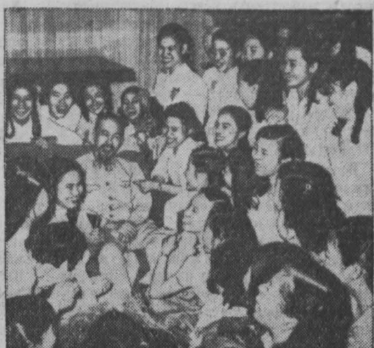
Демократическая Республика Вьетнам. Президент республики Хо Ши Мин среди школьников, которые пришли поздравить его с 65-летием.