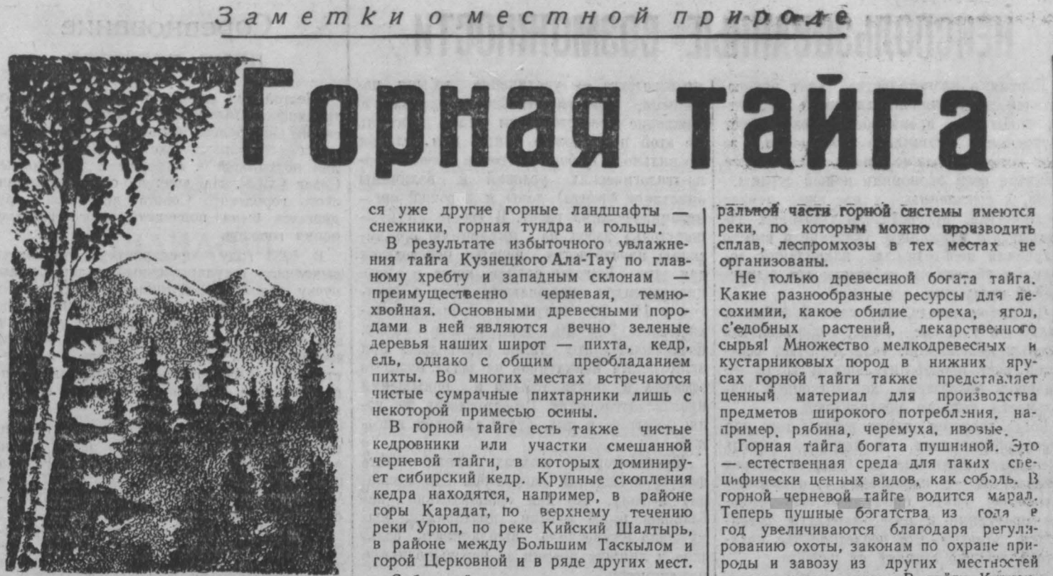
После равнины с лесостепным ландшафтом на территории Кемеровской области начинаются предгорья, покрытые смешанными лесами (сосна, береза, кустарник, редкие стройные лиственницы). Чем дальше в глубину горной системы Кузнецкого Ала-Тау, тем выше горы, тем гуще леса и уже с ними древесными породами.

В ответ на призыв народного правительства