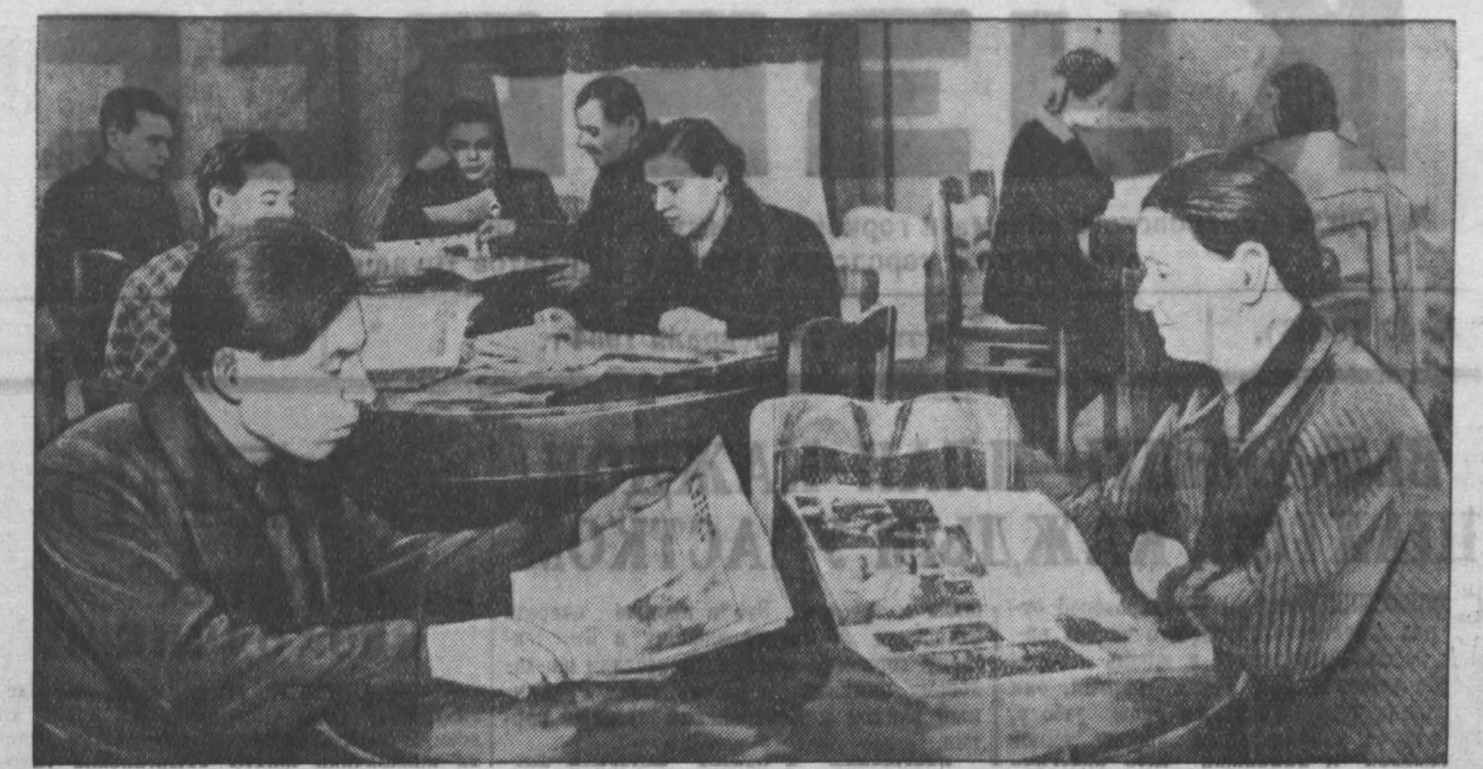
НА СНИМКЕ: в агитпункте избирательного участка № 69, расположенном во Дворце культуры имени Сталина гор. Прокопьевска.

Трудящиеся Кузбасса, неустанно борясь за мир, преисполнены стремления и дальше крепить могущество своей страны, практически содействовать укреплению Вооруженных Сил нашей любимой Родины.