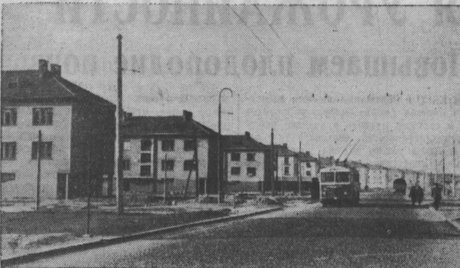
В городах Чехословацкой Республики осуществляется большая программа жилищного строительства. Растут благоустроенные поселки для рабочих. В юго-западной части города Пардубице сооружается поселок «Дукла». Это — название переезда, через который в октябре 1944 года перешли границу Чехословакия советские войска и части сформированного в СССР первого чехословацкого корпуса.

В прошлом году в поселке построено свыше 700 квартир, в 1954 году строители сдвинули в эксплуатацию столько же. Связь поселка с городом поддерживается троллейбусом.