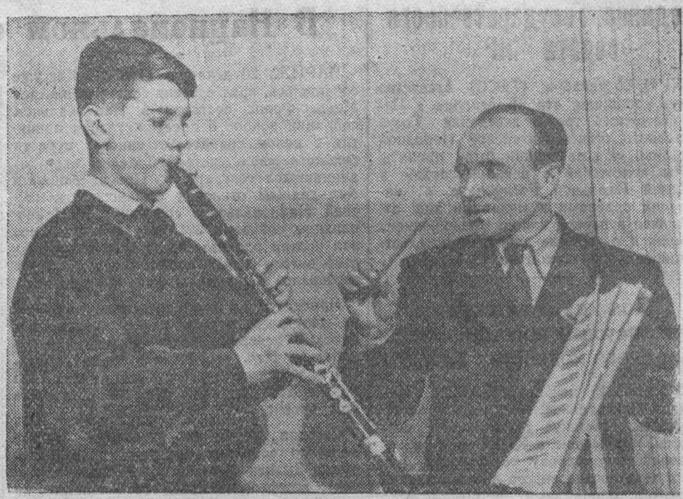
В детской музыкальной школе Центрального района гор. Кемерово по классу виолончели, баяна, фортепиано, духовых и народных инструментов занимаются 252 учащихся...

Такая расстановка сил позволила повысить темпы ремонта, а главное — улучшить его качество. Значительно возросла