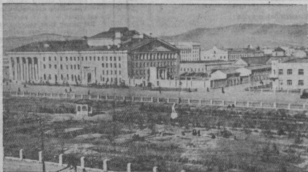
Столица Монгольской Народной Республики — город Улан-Батор.

Большие успехи достигнуты трудящимися МНР и в развитии сельского хозяйства. Особенно быстро развивается животноводство — основная отрасль народного хозяйства, в которой занято большинство населения страны. От животноводства республика получает около двух третей всего народного дохода. Экспорт продукции животноводства составляет 80 процентов всего экспорта страны. Поэтому развитию этой отрасли народного хозяйства партия и правительство уделяют особое внимание. За годы народной власти поголовье скота в МНР увеличилось более чем в 2,5 раза.