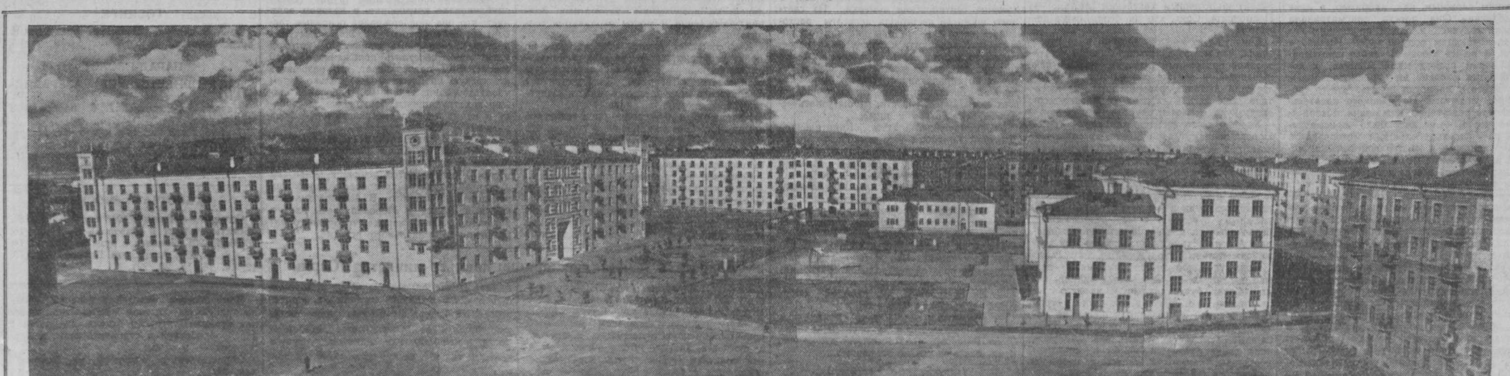
Ежедневно тысячи каменичников, штукатуров, маляров, кровельщиков и других рабочих треста «Сталинскпромстрой» с восходом солнца поднимаются на леса строек родного города. Их взору представляются уходящие вдаль широкие проспекты и кварталы уже возведенных и еще строящихся многоэтажных жилых домов.

Директор совхоза «Астраханский» и начальник стройучастка № 6 треста «Алтайгражданстрой» объявили учащимся обеих групп благодарности за помощь в строительстве важнейших объектов на целинных и залежных землях.