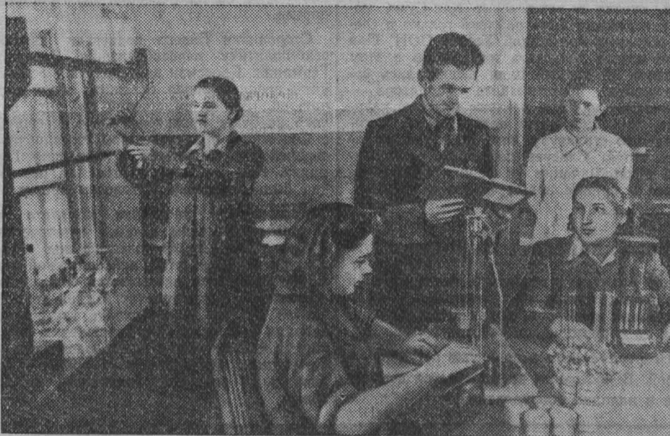
Большую научную работу проводит в районе, Курганской области, опытная ученица Терентия Семеновича Мальцева. НА СНИМКЕ: научные работники в лаборатории опытной станции за исследованием почв.