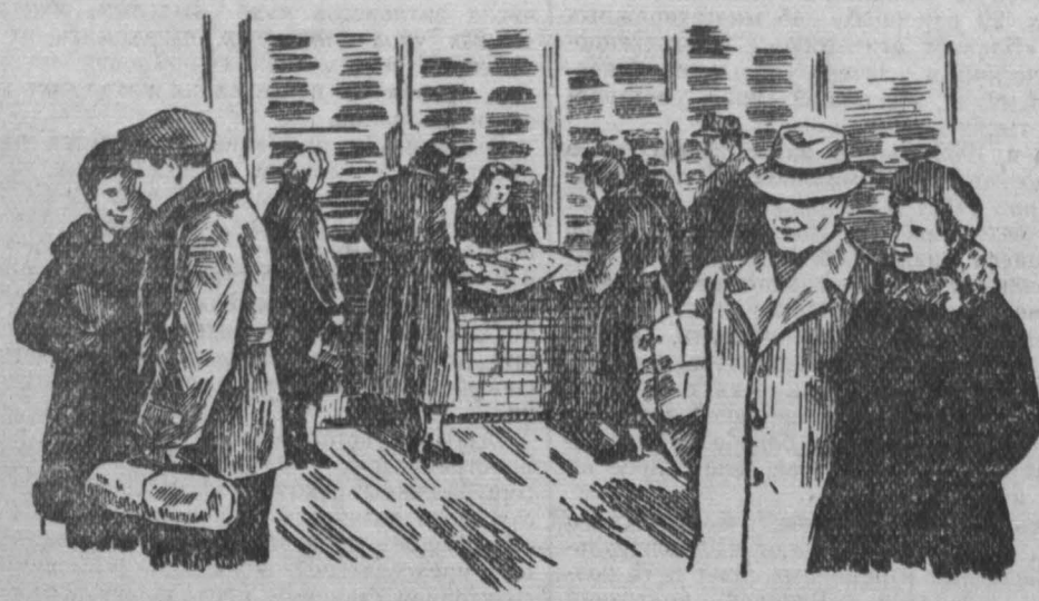
В эти дни в Кемеровском универсаме идет оживленная торговля. Трудящиеся покупают к празднику ценные вещи, подарки своим близким и знакомым.