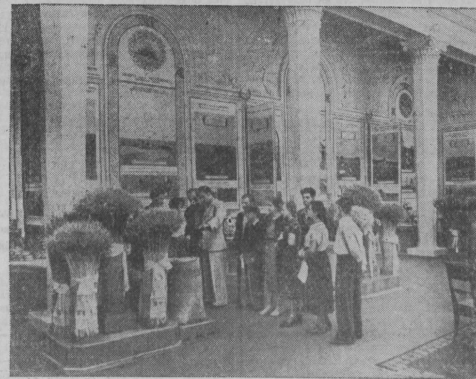
Всесоюзная сельскохозяйственная выставка. НА СНИМКАХ: 1. Посетители у стендов Каменской области в павильоне «Северный Кавказ», 2. Павильон Белорусской ССР.