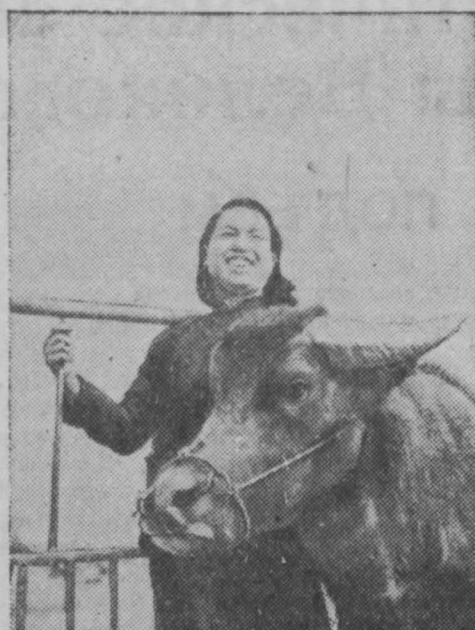
В китайской деревне осуществляются социалистические преобразования. Количество производственных кооперативов выросло за полгода более чем в шесть раз. В группах трудовой взаимопомощи состоит более 50 процентов всех крестьянских хозяйств страны. Руководитель производственными кооперативами и группами трудовой взаимопомощи крестьяне и крестьянки, пользующиеся авторитетом среди своих односельчан.

является отсталой в экономическом и культурном отношениях, в великую индустриальную державу с высоким уровнем современной культуры. Наше дело правое. Правое дело является неуязвимым для любого врага. Основой нашей силы, которая ведет нас вперед в нашем деле, является Коммунистическая партия Китая. Теоретической основой нашего мировоззрения является марксизм-ленинизм. Мы полностью уверены в том, что мы можем преодолеть все трудности и невзгоды и превратить нашу страну в великую социалистическую республику». В заключение своей речи председатель Мао Цзэ-дун говорит: «Мы идем вперед. Мы делаем великое и славное дело, за которое никогда не брались наши предки. Наша цель должна быть достигнута. Наша цель безусловно может быть достигнута». «Пусть же весь 600-миллионный народ нашей страны объединится и борется за наше общее дело!» Да здравствует наша великая родина! Депутаты Собрания источают слова Мао Цзэ-дуна горячими аплодисментами, переходящими в овацию. В зале торжественно звучит Государственный гимн Китайской Народной Республики. По предложению Мао Цзэ-дуна депутаты трехминутным молчанием почтили память борцов, погибших за дело революции. Депутаты бурной овацией встречают предложение Дун Бин-у об избрании президента сессии в составе 97 человек во главе с Мао Цзэ-дуном. Затем объявляется перерыв заседания.