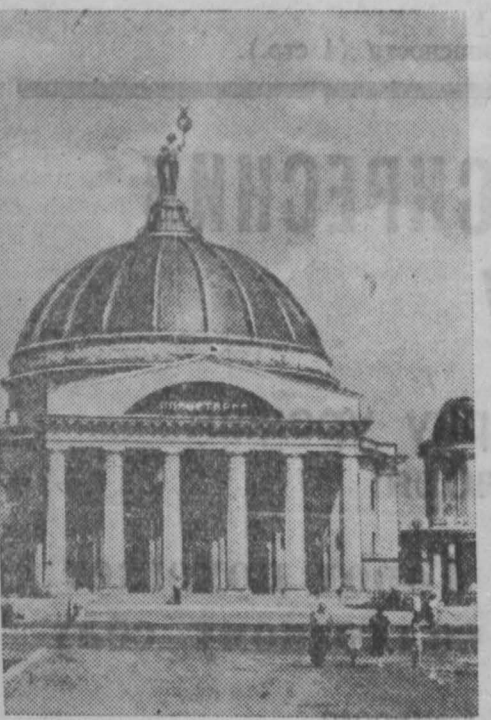
Сталинградский планетарий — подарок городу-герою от трудящихся Германской Демократической Республики. Все основные материалы, изделия и детали, необходимые для постройки здания, и оптическое оборудование сделаны руками трудящихся Германской Демократической Республики.