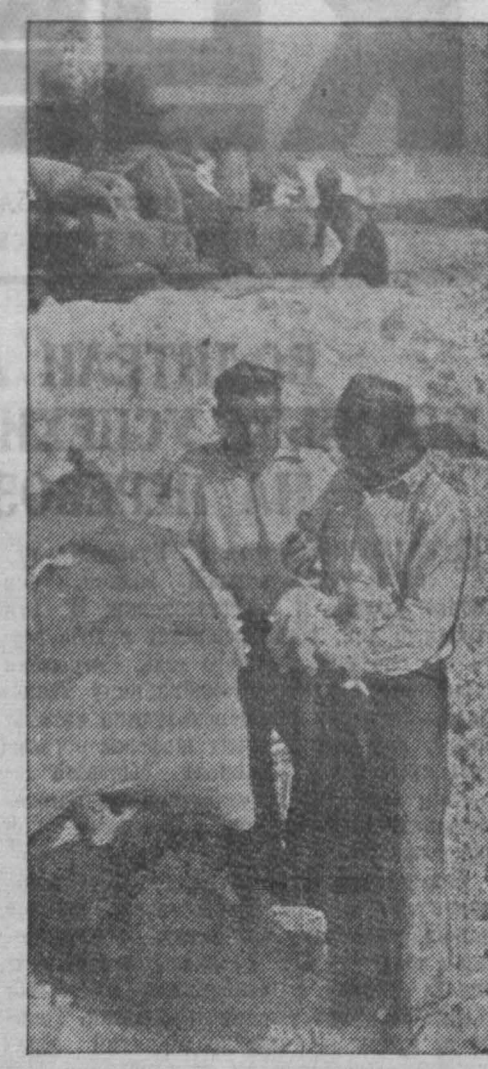
Узбекская ССР. В колхозах Сурхандарьинской области начались массовый сбор хлопка. На Денауский приемный пункт многие колхозы ежедневно сдают по 15—20 тонн хлопка.

Г. УМНОВ. (Корр. «Кузбасса»). с. Усть-Серта, Чебулинского района.