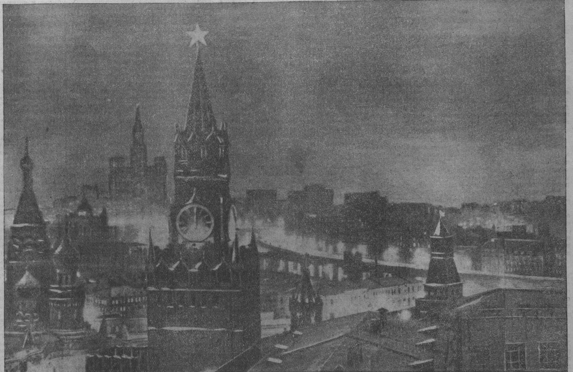
Москва, Красная площадь. Полночь...