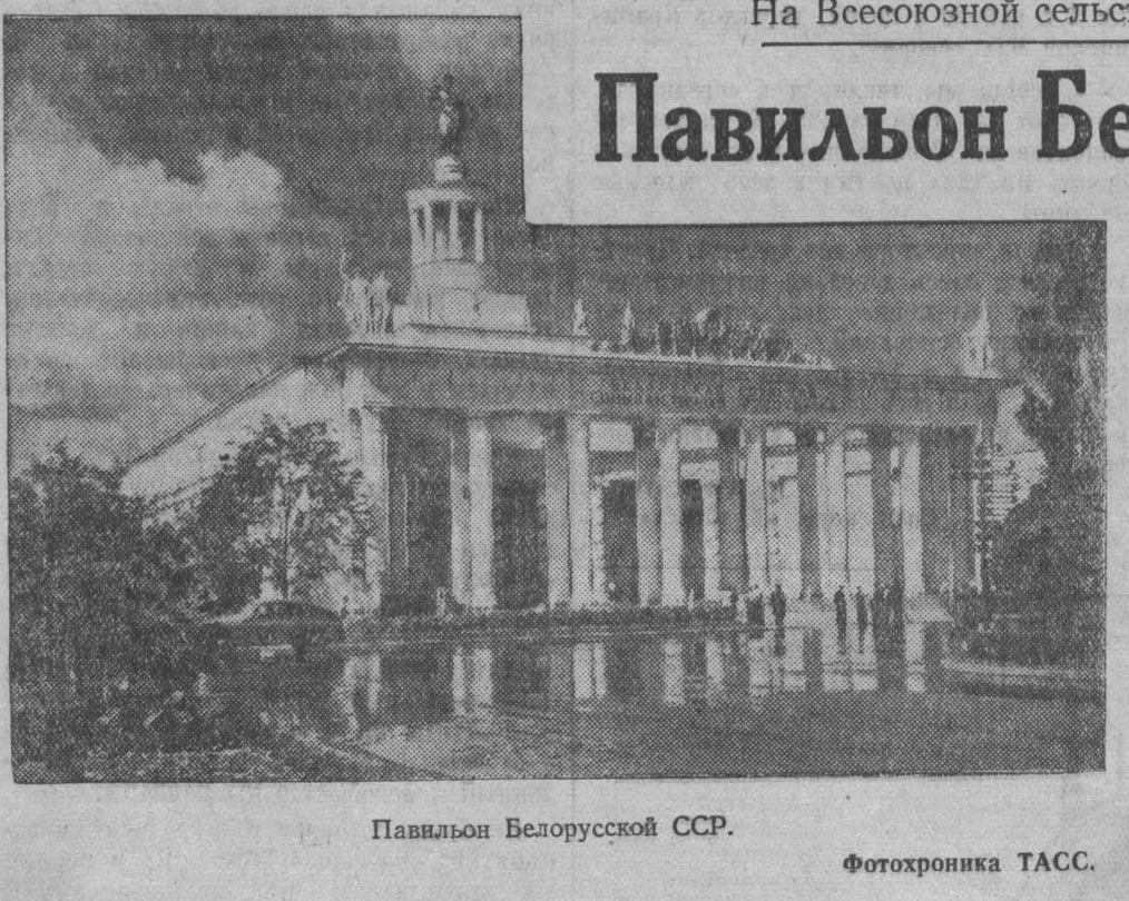
Павильон Белорусской ССР.