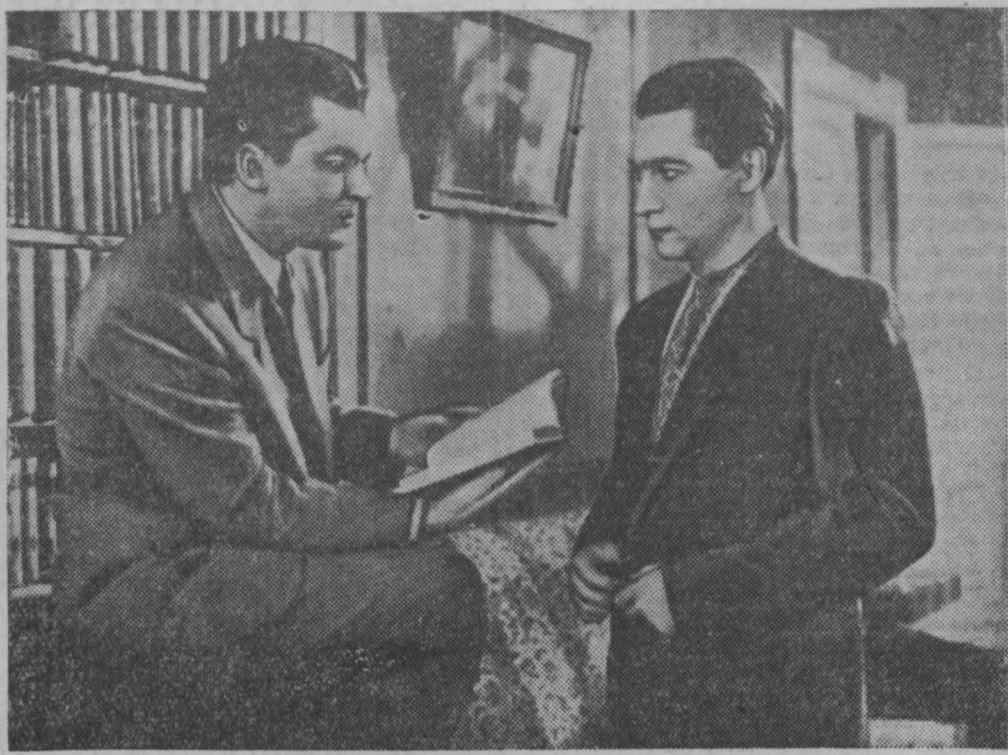
Кадр из фильма «Об этом забывать нельзя».

«О чем нельзя забывать». Так назвал одну из своих статей замечательный украинский писатель, пламенный борец за коммунизм Ярослав Галан. В ней он писал: