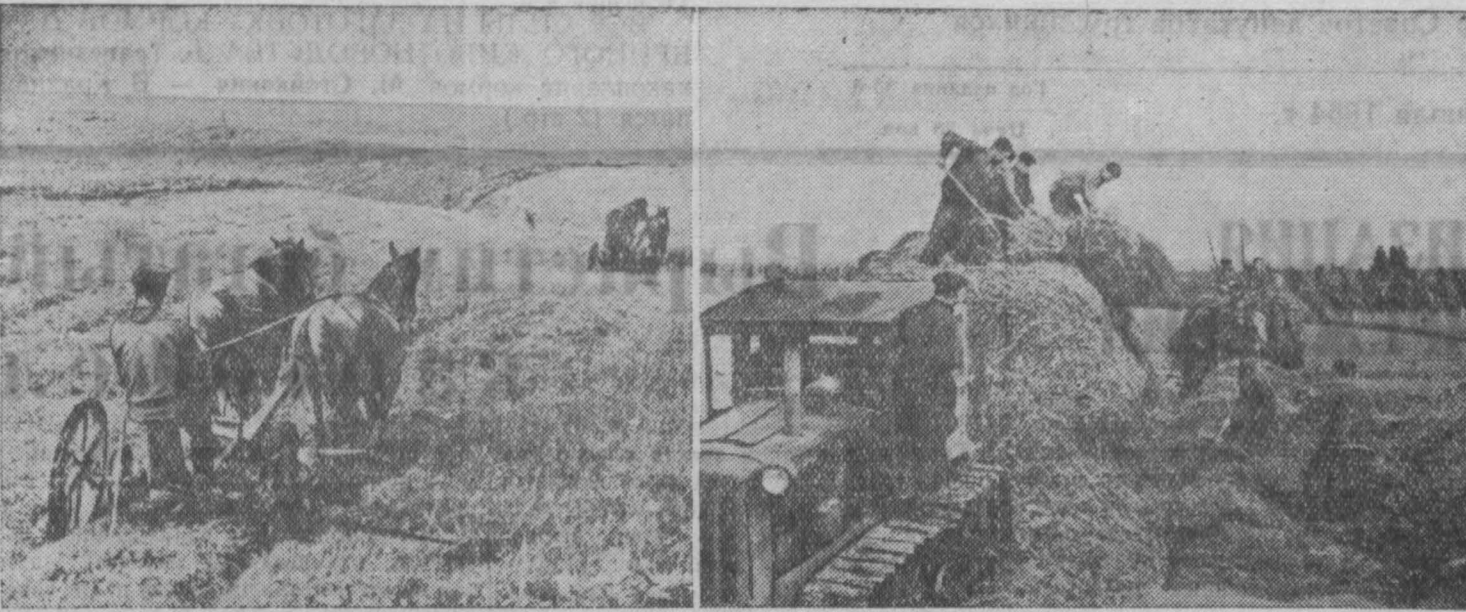
Наступила горячая пора заготовки кормов. Колхозники сельхозартеля имени Карла Маркса Кемеровского района, полным ходом ведут силосование зеленой массы. Конными сенокосилками скашивают в день по 4-5 гектаров.