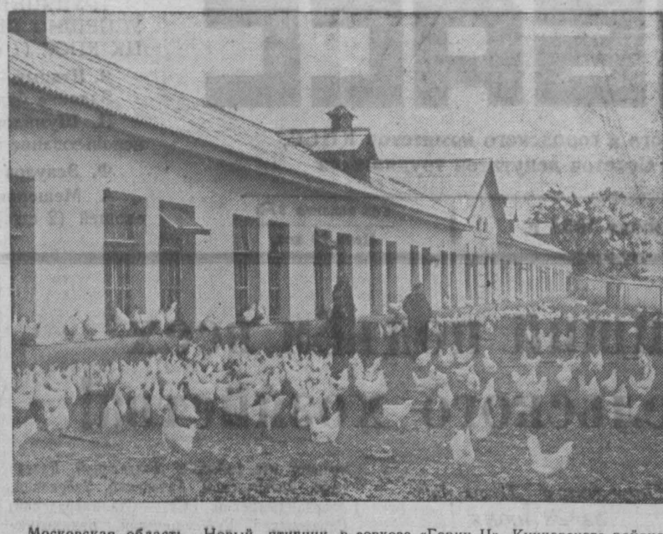
Московская область. Новый птичник в совхозе «Горки II», Кузнецкого района.