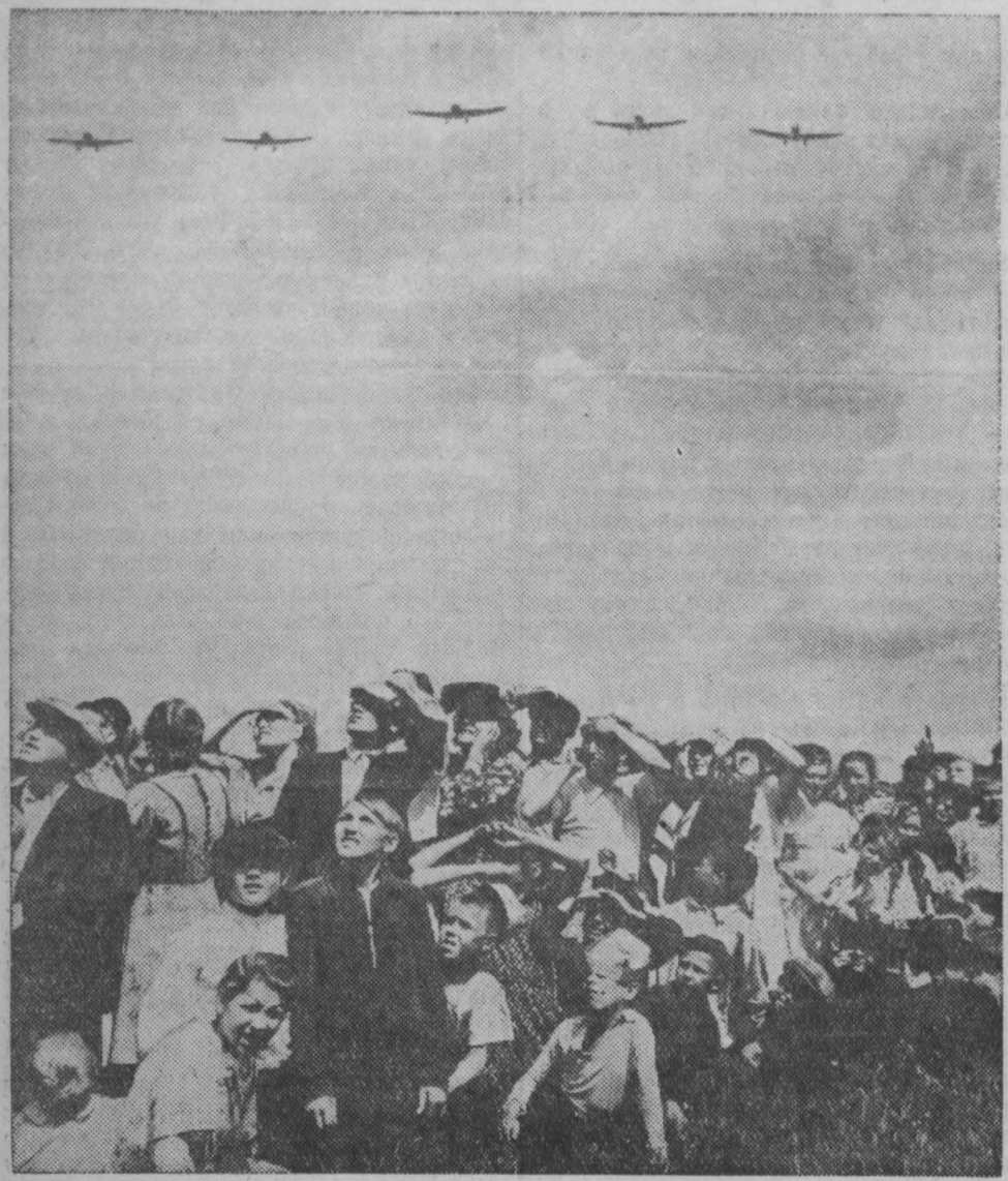
НА СНИМКЕ: на авиационном празднике в Кемерово.

По шоссе быстро проносятся солидные автобусы, обтекаемые «Победы», юркие мотоциклы, торпильные «Москвичи». Июньское солнце весело сверкает на зеркальных лаковых кузовках. Машини одна за другой везают на территорию Кемеровского аэродрома. Здесь в воскресенье состоялось праздничное посвящение Дню Воздушного Флота СССР. Вот в воздухе влетают зеленые огоньки ракет. С поля аэродрома поднимается группа самолетов, которую ведет пилот Исаков. Выстроившись клином, низко проносятся они над зрителями.