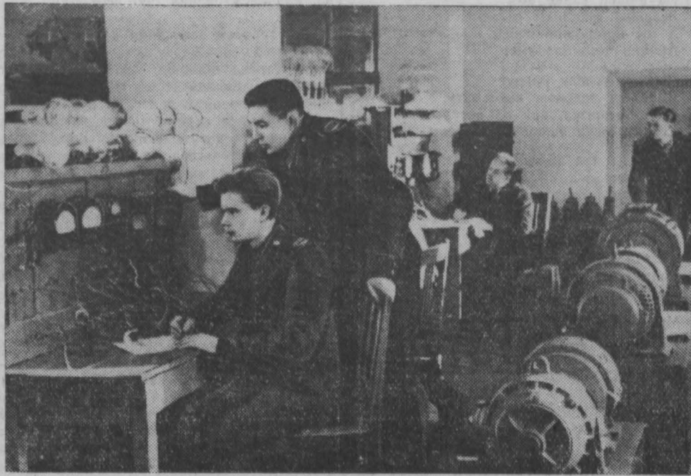
В электротехнической лаборатории Кемеровского горного института.

Адрес: г. Кемерово, горный институт приемной комиссии.