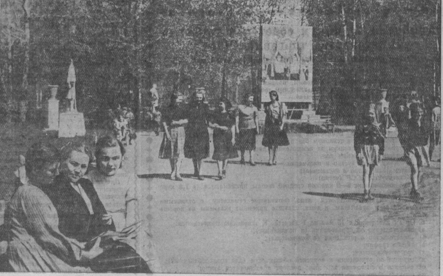
НА ШИМКЕ: в Кемеровском городском саду.