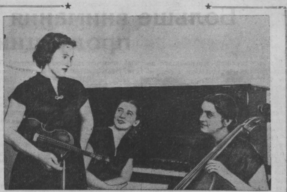
Михаил Иванович Глинка — один из любимейших народом композиторов. В дни 150-летия со дня его рождения музыка Глинки с новой силой звучит во всех уголках страны. Советский народ славит своего великого сына. Широко отмечается эта замечательная дата и у нас, в Кузбассе.

ПХЕНЬЯН, 3 июня. (ТАСС). Сегодня в 12 часов дня с Пхеньянского вокзала отшел первый поезд прямого сообщения Пхеньян—Пекин. Поезд Пхеньян—Пекин будет регулярно отправляться два раза в неделю. В столицу Китая он прибывает через 34 часа.