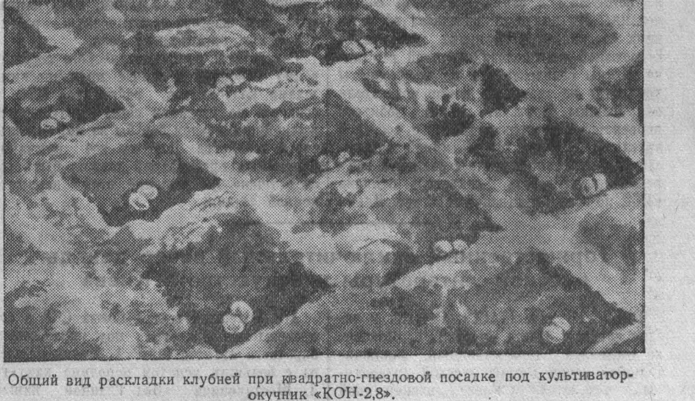
Общий вид раскладки клубней при квадратно-гнездовой посадке под культиватор-окучник «КОН-2,8».

вдоль борозды в местах пересечения маркерных линий с бороздой, а на дно борозды кладут удобрения. Ни в коем случае нельзя класть клубни на дно борозды, так как там пойдет колесо трактора.