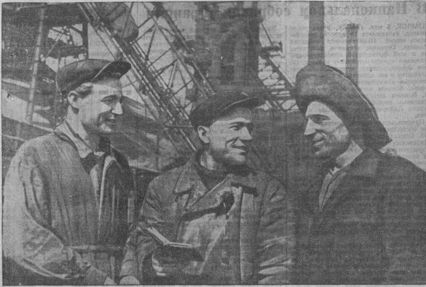
Доменная печь № 1 Кузнецкого металлургического комбината — комсомольско-молодежная. Ее коллектив обязался в нынешнем году выдать сверх плана 4 тысячи тонн чугуна и сэкономить 400 тысяч рублей государственных средств. Недавно молодые доменщики обратились с письмом к коллективу комсомольско-молодежной домы № 3 Магнитогорского комбината и вызвали его на социалистическое соревнование.