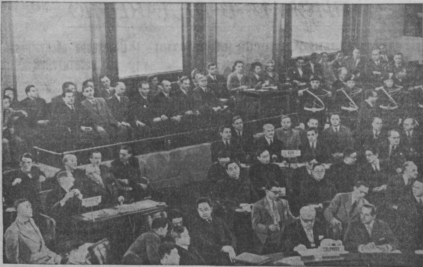
Женевское совещание министров иностранных дел. НА СНИМКЕ: делегации Советского Союза, Китайской Народной Республики и Англии в зале заседаний.