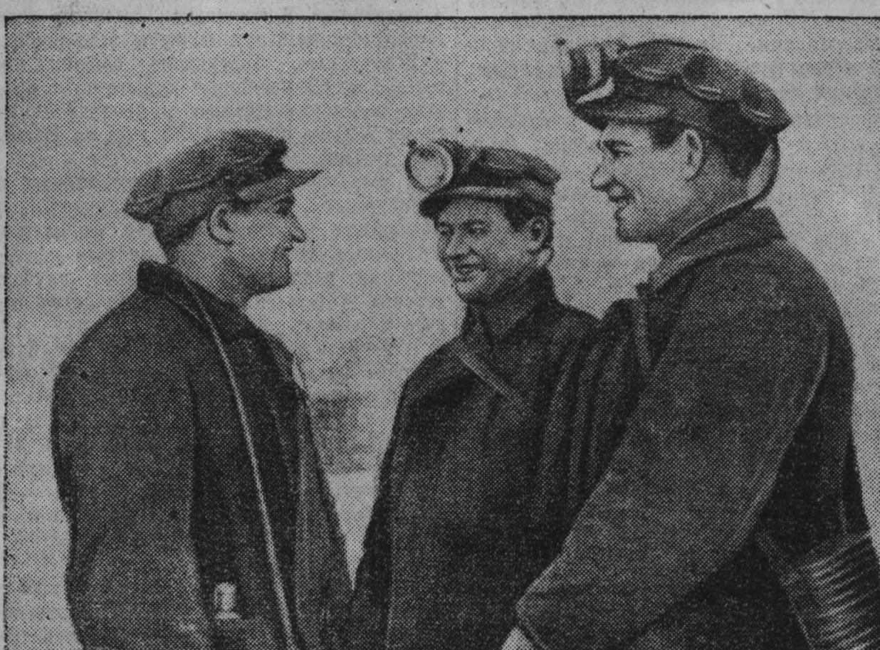
По итогам Всесоюзного социалистического соревнования в октябре коллективу шахты «Центральная» треста «Кемеровоуголь» присуждена вторая премия ВЦСПС и Министерства угольной промышленности.

Сегодня в коксохимическом цехе закончила работу межзаводская школа передового опыта. Участники ее — машинисты загрузочных вагонов и коксовальщики, приехавшие из Кемерово, Сталинка, Челябинска, Орска, Нижнего Тагила, изучили лучшие приемы загрузки коксовых батарей на Магнитке.